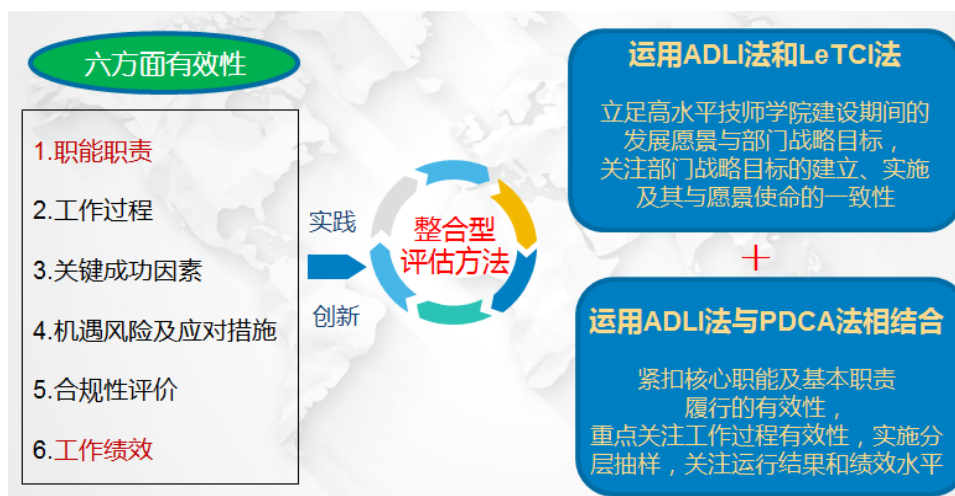
图4 学院实施整合型绩效评估方法

学院成功摸索出适合技工教育的整合型评估方法，综合评价职能职责、工作过程、关键成功因素、机遇风险及应对措施、合规性评价和工作绩效的有效性，综合运用 ADLI、LeTCI、PDCA 等方法，定期开展绩效评价和成熟度评审，重点关注教育教学的过程有效性、运行结果和绩效水平，并将评价（评审）结果与中层考核晋升、部门绩效奖励直接挂扣，为学院科学决策提供依据。