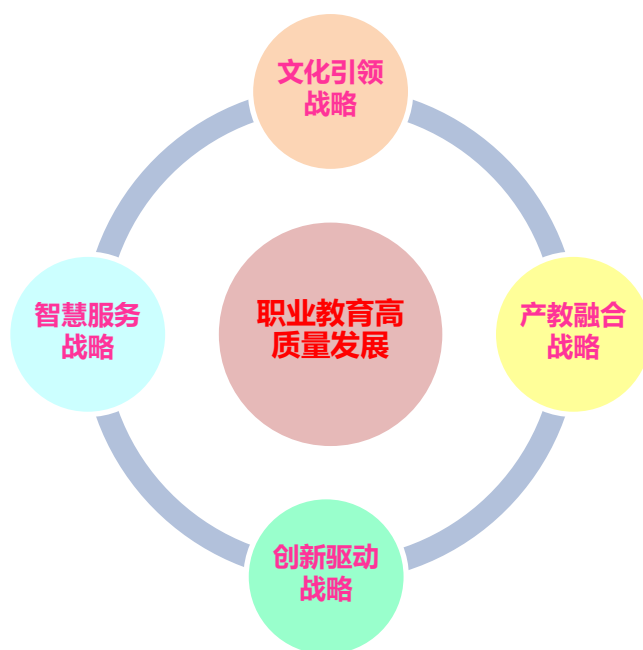
图 2 学院 “四大发展战略” 推动高质量发展

学院高层领导立足学院长期发展积淀与办学成果，本着对政府部门、全体师生、学生家长、职业培训学员、合作伙伴高度负责的态度，通过科学集体决策和系统策划，通过科学研判技工教育发展趋势，建立了文化引领、产教融合、创新驱动、智慧服务“四大发展战略”，从使命绩效、客户层面、管理运行、学习成长四个维度，制定了 32 项战略目标。针对每一项战略主题，除了以三年为区间确定关键绩效指标外，还配套相应的行动计划(或实施方案)以及责任人，将战略主题转化为具体工作任务，确保战略落地、责任到人，形成了具有轻工特色的全面质量管理责任体系。