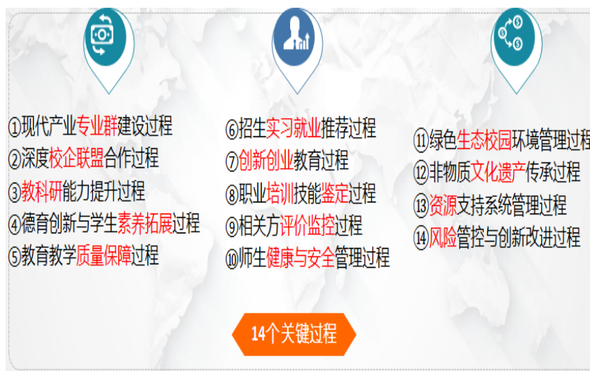
图3 学院办学治校和教育教学关键绩效过程

大质量、环境和职业健康安全“三标一体化”管理体系整合力度，统一实施内审、管理评审、监督审核和认证审核，成功摸索出技工院校“三标一体化”管理运行模式，为兄弟院校建立实施整合型管理体系做出了榜样。2019年1月，学院率先通过了质量、环境和职业健康安全“三标一体化”国际认证；2022年7月，再次通过“三标一体化”国际认证，得到了国家认证机构的权威认可。