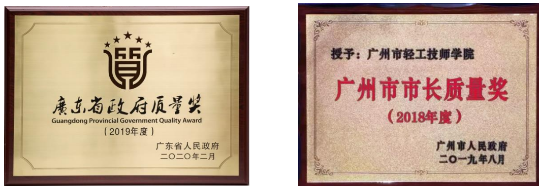
图 5 学院荣获广东省政府质量奖、广州市市长质量奖的牌匾

2019 年，学院荣获 2018 年度广州市市长质量奖，通过升级版质量、职业健康安全、环境“三标一体化”管理体系国际认证。2020 年，学院荣获 2019 年度省政府质量奖，成为广东历史上第一家荣获省政府质量奖的学校，也是全国首家荣获省级政府质量奖的技工院校。2021 年，经广东省质量强省工作领导小组推荐，学院组织申报第四届中国质量奖。近年来，学院认真履行政府质量奖获奖单位的责任与义务，积极宣传交流质量管理成功经验与特色做法，发挥示范带动作用，指导帮助高职院校、技师学院等单位申报各级政府质量奖，努力促进职业教育质量管理整体水平的提高。