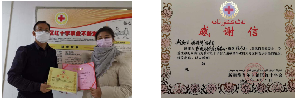
图1 新疆质协向新疆维吾尔自治区红十字会捐款及感谢信

红十字会新冠肺炎疫情防控专项基金捐款共计5万元，为解决目前新疆地区抗击疫情医疗器械、防护用品短缺贡献一份力量。